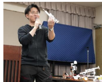
ロボメイツご紹介 (エアグラウンド様)